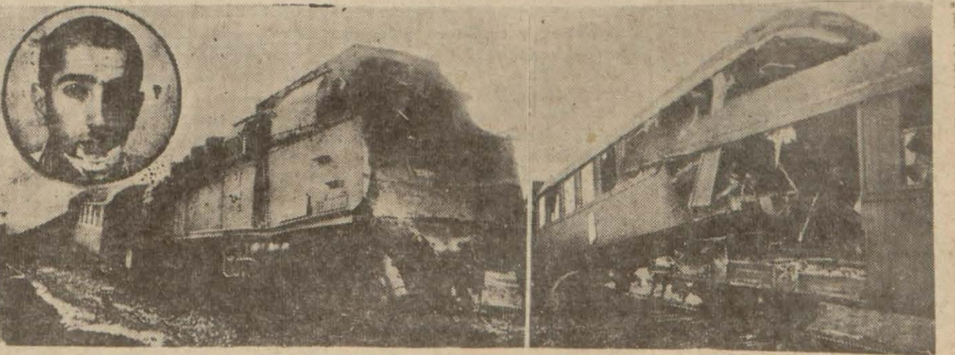
Sanliyö katari faciadan sonra (Köşede katartın mahnistri)

Dün sabah Suadiye ile Erenköy arasında 8 kişnin ölümü ve 13 ki- şinin yaralanması neticesinde der- hal ölmüşlerdir.